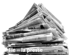
File - la presse